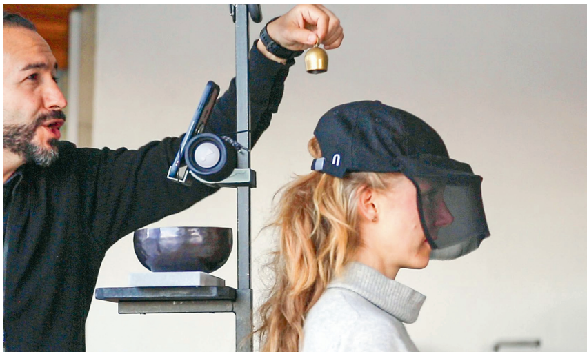
Woher kommt der Klang? Das Kurtheater lädt zum Entdecken ein

Einmal trägt das Publikum offene Kopfhörer und hört zur Live-Musik solche aus dem Kopfhörer: Es kann nicht mehr erkennen, was aus dem Kopfhörer und was live erklingt. Das Publikum sitzt zudem hinter einer Glasscheibe. In dieser spiegeln sich