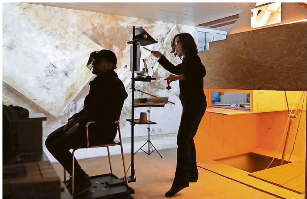
Aufführung «Lit Marveil».

Ein Projekt dies- und jenseits des Vereinatunnels; eine Komposition, die man nur vollständig hören kann, wenn man auch einen Teil auf der anderen Seite des Tunnels hört: Die Idee ist, den Austausch anzuregen. Die beiden Bündner Koproduktionspartner, das Atelier Bolt und die Fundazium Nairs stellen ihre Arbeit jeweils am andern Ort vor.