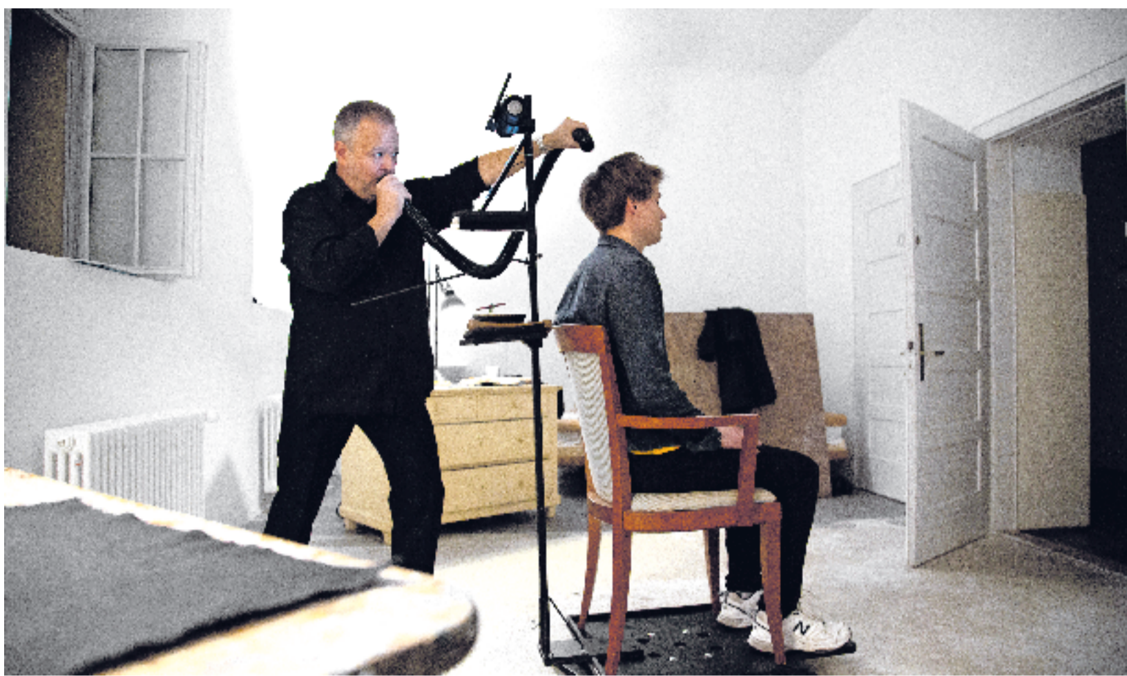
L'auditor es per üna jada i'l center da la performance 1:1 «Lit Marveil» chi ha gnü lö tanter oter eir a Nairs.